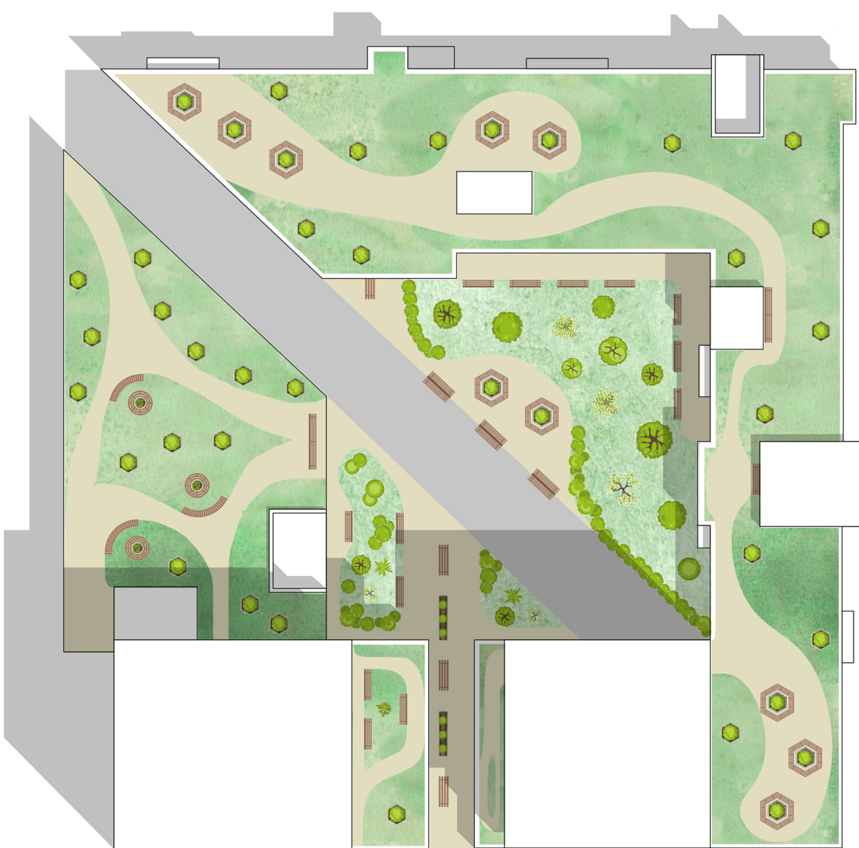
Vista delle Coperture Scala 1:400